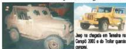
Jeep na chegada em Teresina no Cerapió 2003 e do Troller quando comprei.